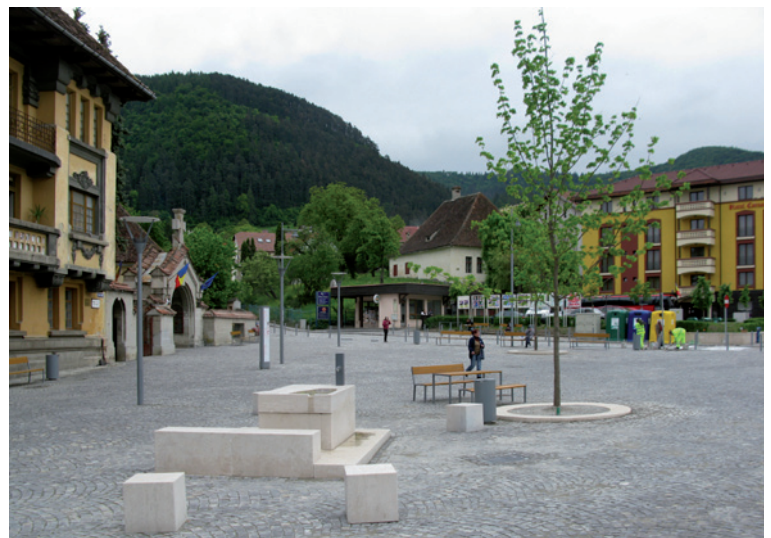
Piața Unirii, Brașov