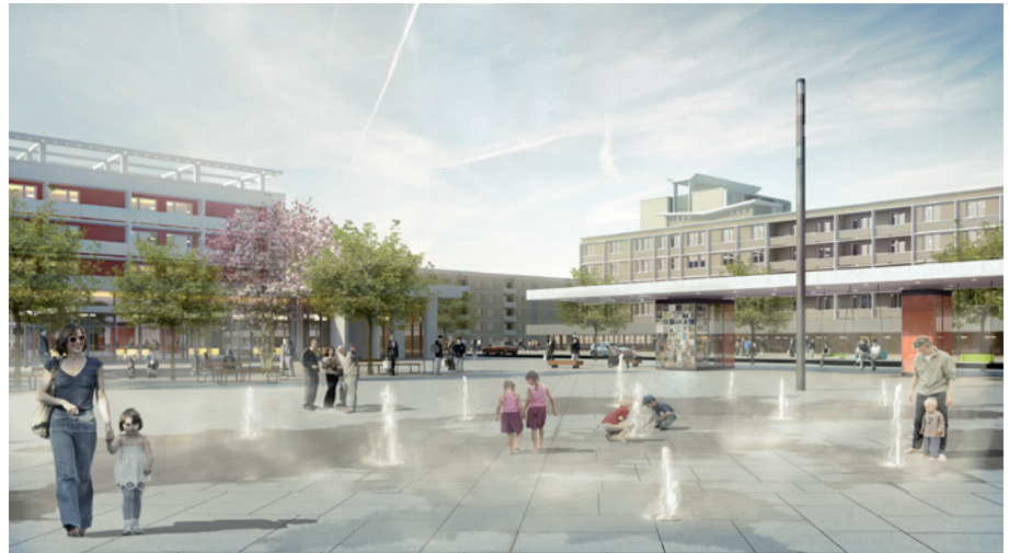
Piața Revoluției, Baia Mare, ilustrare

În luna mai a fost inaugurată noua amenajare a Pieței Unirii din Brașov. Pentru noi – un prilej de satisfacție, la finalul unui proiect început odată cu concursul de soluții din 2008 și pe parcursul căruia ne-am bucurat de o foarte bună colaborare cu administrația locală. Piața – avînd o poziție semnificativă în structura și în istoria orașului – a fost transformată prin eficientizarea circulației și a parcarilor într-un centru de cartier pentru Schei și într-un spațiu multifuncțional și primitor pentru Brașov.