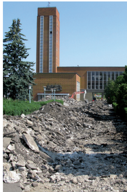
Șantier la fosta uzină Tractorul, Brașov