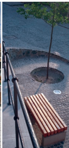
Loc de odihnă lângă zidul cetății, Sibiu