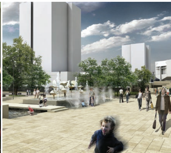
Reamenajarea Pieței Teatrului, Tîrgu Mureș