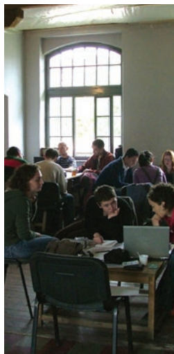
Workshop la Zilele Arhitecturii