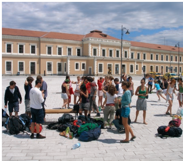
Piața Gării, Sibiu