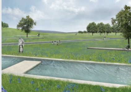
Colaborări cu plan&werk, Bamberg

■ Prezență publică. În mai, Planwerk a participat la Zilele Arhitecturii din cadrul Facultății de Arhitectură organizînd, printre altele, un workshop studentesc pe tema spațiilor publice. Cele două conferințe susținute la universități din Germania (Wuppertal și Dessau) precum și prezentarea biroului în cadrul Centrului de Arhitectură din Hamburg s-au bucurat de un real interes. Un ultim moment al prezenței noastre publice în 2007 și cel mai îmbucurător pentru noi este premiarea proiectului „Erlebnisraum Altstadt” Sibiu în cadrul concursului organizat de OAR Transilvania în decembrie. Îi felicităm pe colaboratorii noștri și le mulțumim atât lor, cît și coordonatorilor acestui proiect, GtZ Sibiu.