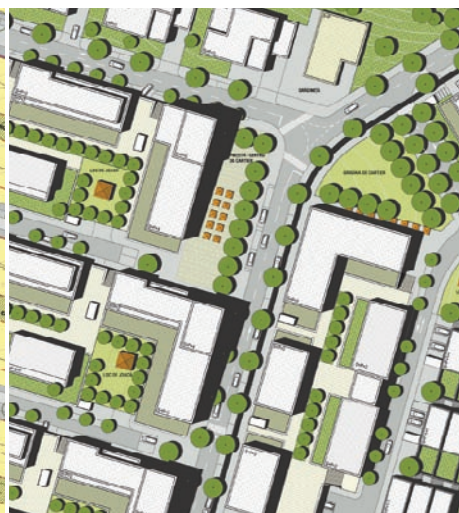
Plan Urbanistic Zonal Plaiuri , Cluj - reglementări și ilustrare