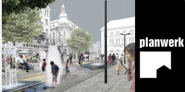
Jocuri de apă și platani în Piața Unirii din Cluj

■ Începând din 2005, Planwerk ia parte la pregătirea Sibiului pentru 2007, an în care, alături de Luxemburg, orașul este desemnat Capitală Culturală Europeană. Astfel, sub tutela programului de cooperare româno-german „Erhaltende Stadterneuerung der Altstadt von Hermannstadt” a fost elaborat un proiect cu titlul „Erlebnisraum Altstadt”. Acesta conține 10 pachete de măsuri menite a pune în valoare spațiul public din centrul istoric al Sibiului. Inițial, Planwerk a fost contractat pentru elaborarea unui studiu de amenajare și a unui studiu de fezabilitate. Între timp, cele două studii au fost finalizate, adoptate de către Consiliul Local și se află în pragul realizării. Lucrările, care urmează a fi finalizate pînă la sfîrșitul lui 2006, beneficiază de o finanțare care combină fonduri publice locale cu un credit acordat administrației sibiene de banca Kreditanstalt für Wiederaufbau.