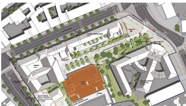
PUD Parcaj supraterean etajat, str. Moșilor, Cluj