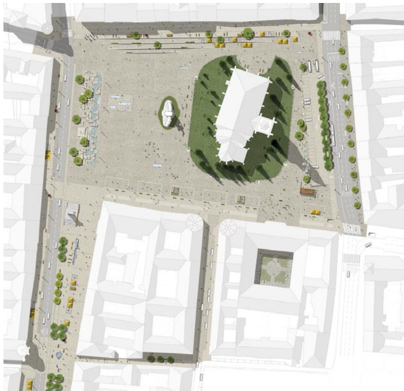
Plan de amenajare, Piața Unirii - bulevardul Eroilor, Cluj