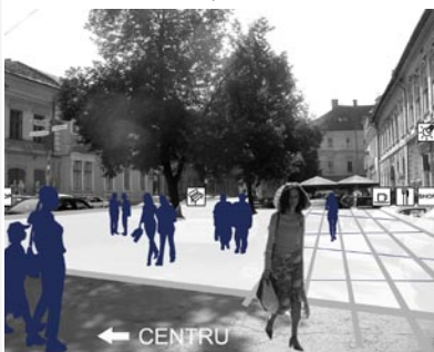
reorganizarea spațiilor stradale, zona centrală, Cluj