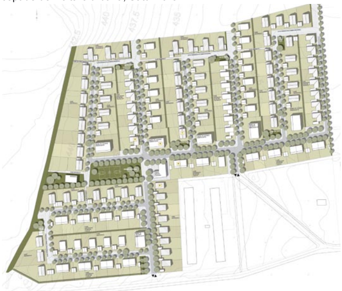
PUZ, complex rezidențial, Gilău, jud. Cluj