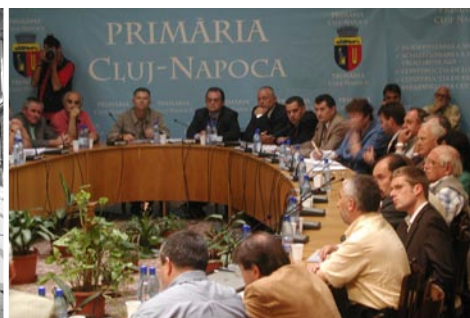
conferință la primăria municipiului Cluj